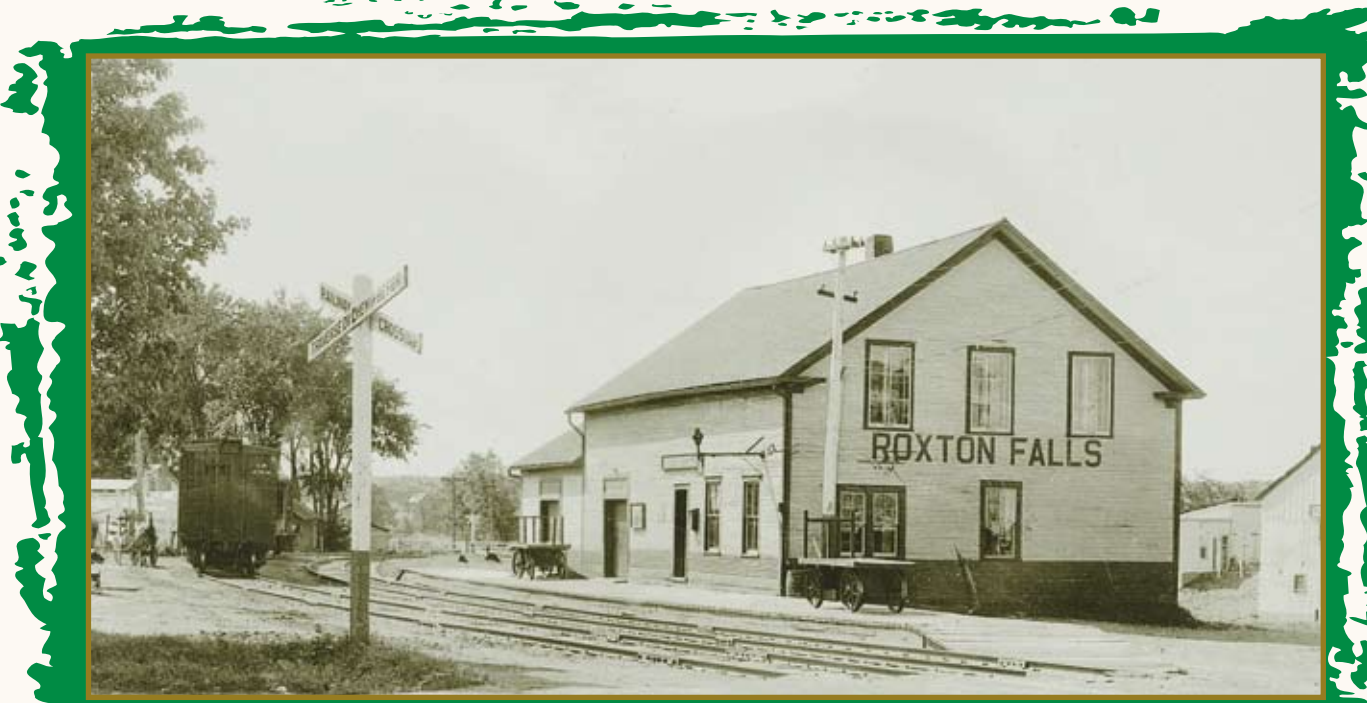
LA GARE DU CANADIEN PACIFIQUE, VERS 1920