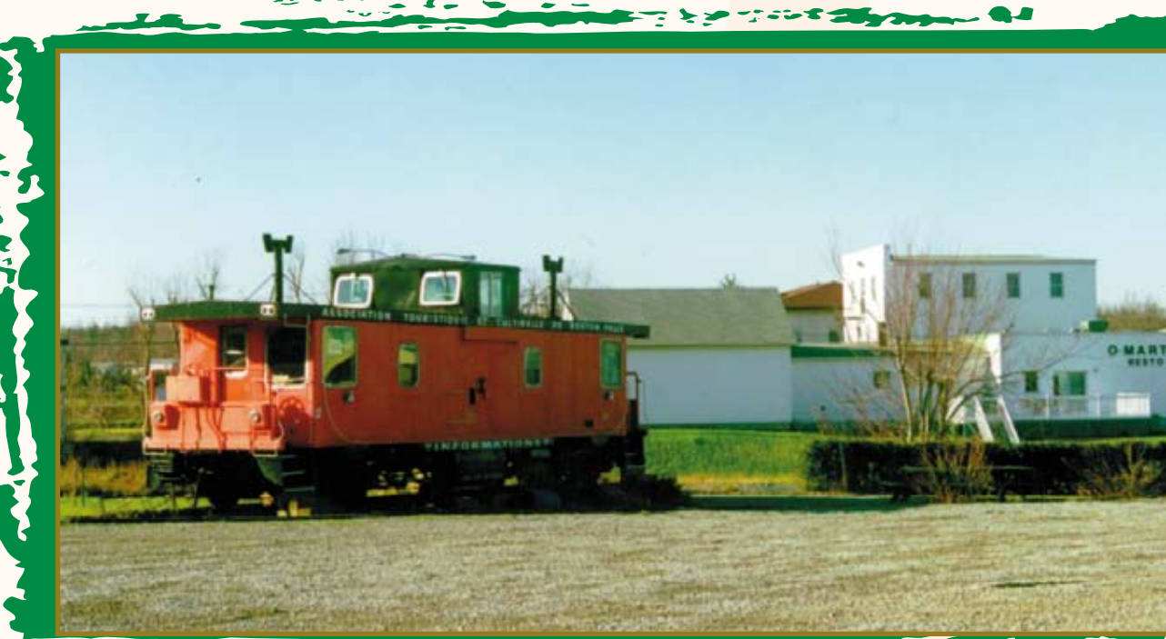
LE SITE DE LA GARE DEPUIS 1997