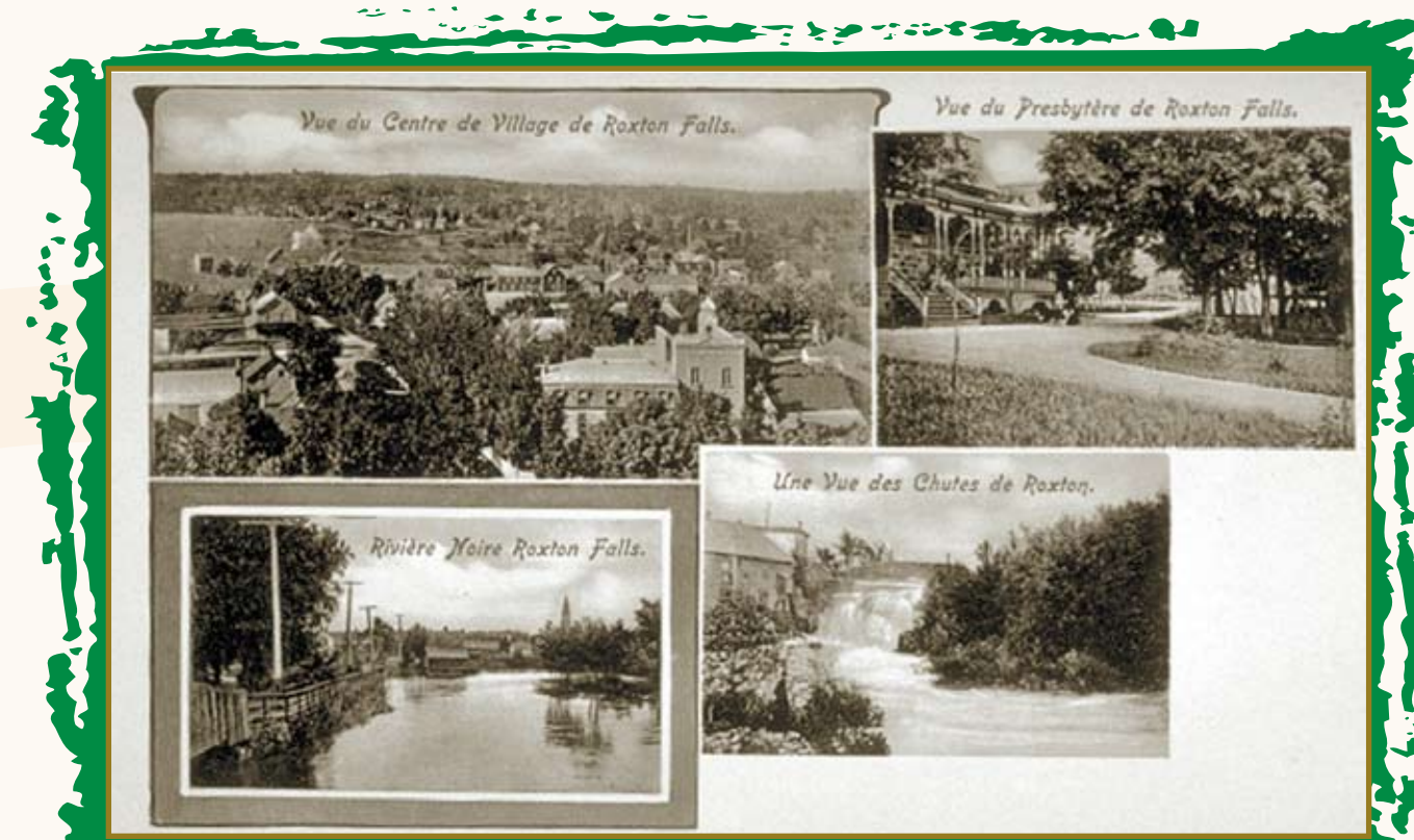
QUELQUES VUES TYPIQUES DE ROXTON, VERS 1920

À cette rencontre historique, il fut unanimement décidé qu'une pétition serait envoyée au gouvernement lui demandant de forcer la compagnie à compléter la voie ferrée sans aucun autre délai, à défaut de quoi les autorités gouvernementales pourraient s'en saisir afin de terminer les travaux.