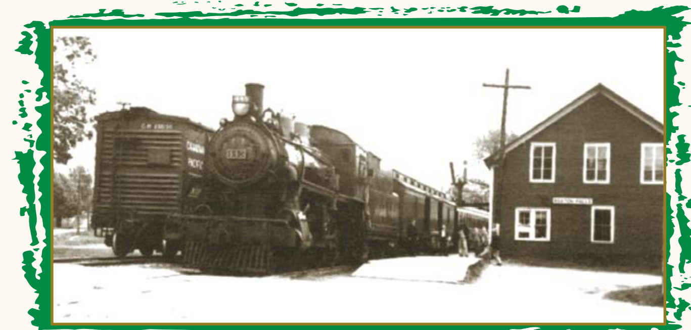
LA 445 PASSAIT 4 FOIS PAR JOUR À ROXTON

Ne disait-on pas, en 1877, que plusieurs entreprises manufacturières n'attendaient que l'arrivée du chemin de fer pour s'établir? Il est certain que les industriels et les commerçants locaux firent tout ce qui était en leur pouvoir pour hâter sa réalisation. Conscients que leur propre prospérité en dépendait, ils n'hésitèrent pas à endetter la municipalité au delà de ce qu'elle pouvait supporter.