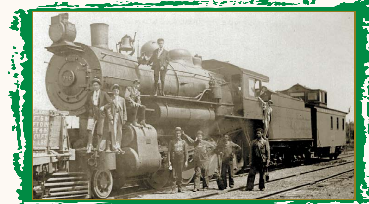
MODÈLE DE LOCOMOTIVE EN USAGE VERS 1900

6 juin 1881 : La compagnie de chemin de fer du Sud-Est (Eastern Counties) transporte la créance de la municipalité aux Sulpiciens de Montréal.