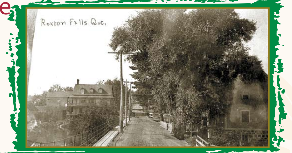
UNE RUE AU DÉBUT DU XX e SIÈCLE

Le 5 avril 1848, à Montréal, une grande assemblée eut lieu au marché Bonsecours. On affirme que 8 000 personnes y assistèrent et approuvèrent la fondation de l'Association des Établissements Canadiens des Townships sous la présidence de l'évêque de Montréal, M gr Ignace Bourget. On a ciblé en priorité certains lieux d'intervention dont le canton de Roxton et des ententes furent établies avec la British American Land Company (BALC). Hélas, la présence de politiciens dans le comité provoqua la discorde et la mort de l'association en moins de six mois; M gr Bourget restait seul pour faire face aux obligations. Nous savons qu'il eut recours aux fonds de la Propagation de la Foi, fondée une dizaine d'années auparavant, et que le gouvernement apporta aussi une contribution.