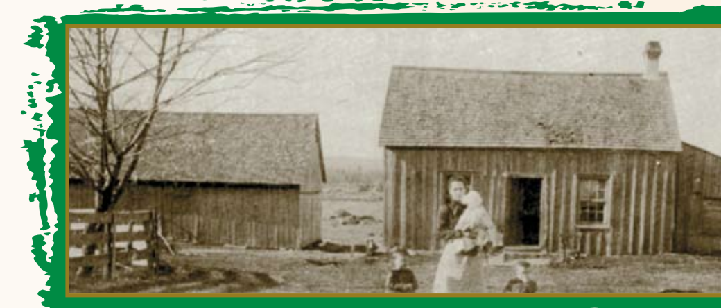
ÉTABLISSEMENT D'UN COLON AU DÉBUT DE LA PAROISSE

Malgré une certaine propagande contre Roxton, le projet fut bel et bien entrepris et plusieurs familles de Montréal s'y installèrent pendant l'été de 1848. Cependant, il faut signaler qu'un début de village existait déjà sur les lieux, aménagé par la BALC qui entrevoyait d'y faire passer le futur chemin de fer.